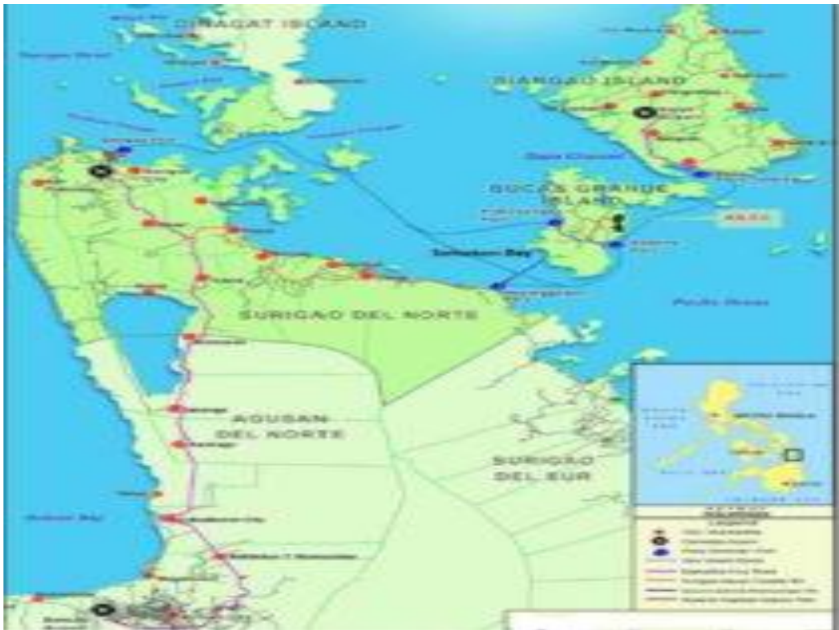
Figur 2. Mapa ng Munisipalidad Surigao del Norte

Makikita sa susunod na pahina ang mapa, kung saan nabibilang ang Surigao del Norte.